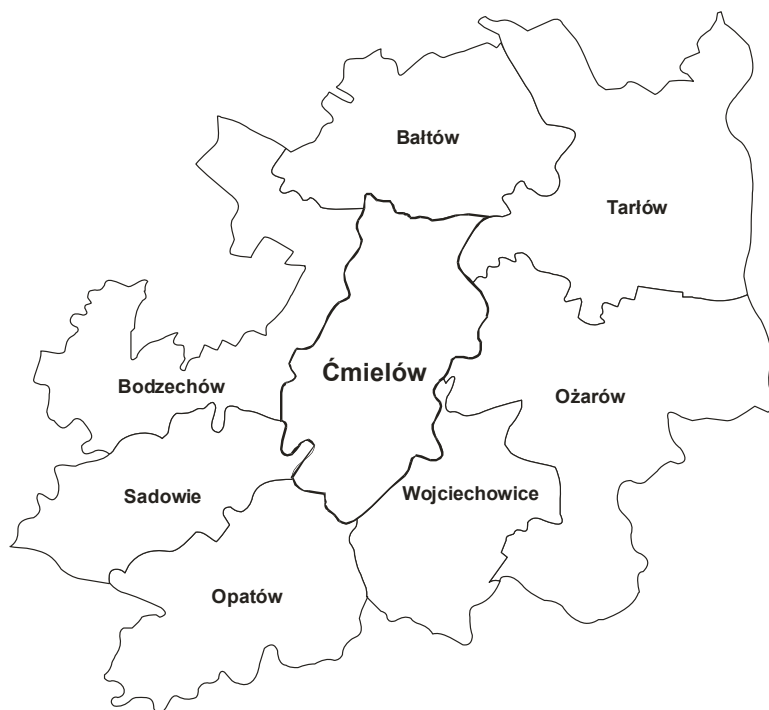
Rys. nr 2. Położenie gminy Ćmielów względem sąsiednich gmin