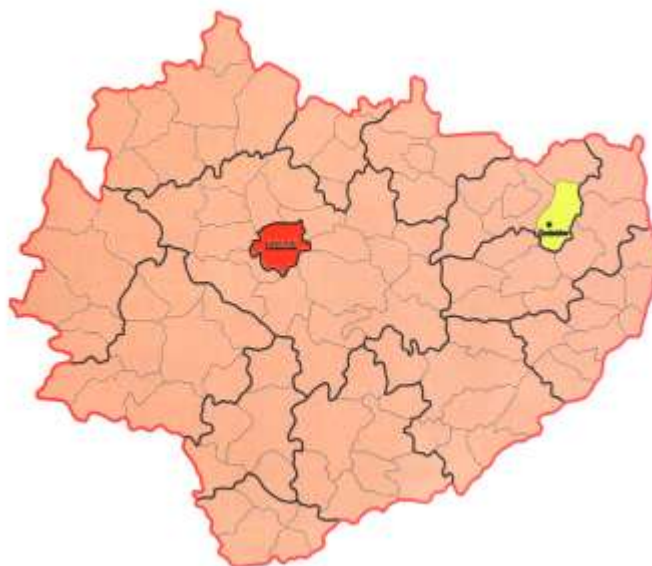
Rys. nr 1. Lokalizacja gminy Ćmielów na tle województwa świętokrzyskiego

W latach 1975 – 1998 miasto i gmina Ćmielów stanowiło część województwa tarnobrzesckiego, a wcześniej województwa kieleckiego.