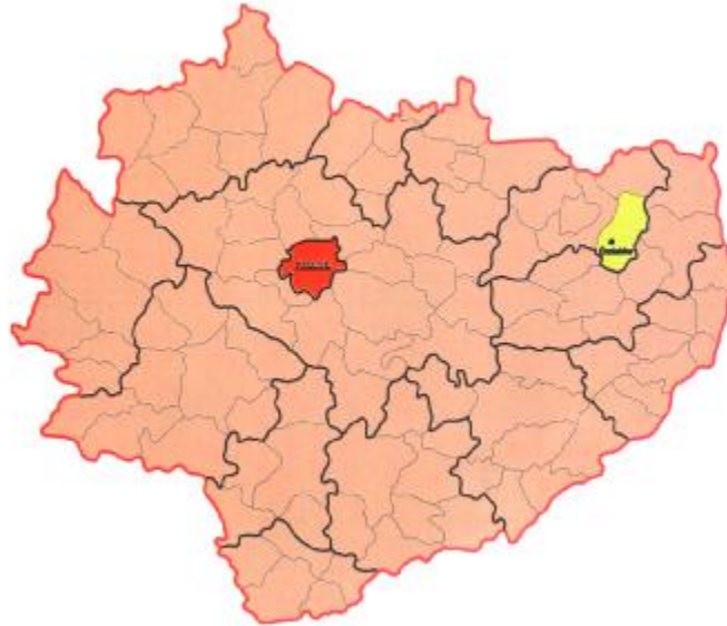
Rys. nr 1. Położenie gminy Ćmielów na tle województwa świętokrzyskiego

Miasto Ćmielów należy do gminy miejsko – wiejskiej położonej w obrębie Województwa Świętokrzyskiego, w powiecie Ostrowieckim, w jego wschodniej części. W latach 1975 – 1998 miasto i gmina Ćmielów stanowiło część województwa tarnobrzesckiego, a wcześniej województwa kieleckiego.