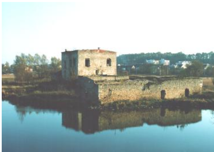
Rys. nr 2 Ruiny zamku w Ćmielowie

Walory naturalne, zabytki kultury materialnej sprawiają, iż teren Ćmielowa jest atrakcyjny krajobrazowo i turystycznie.