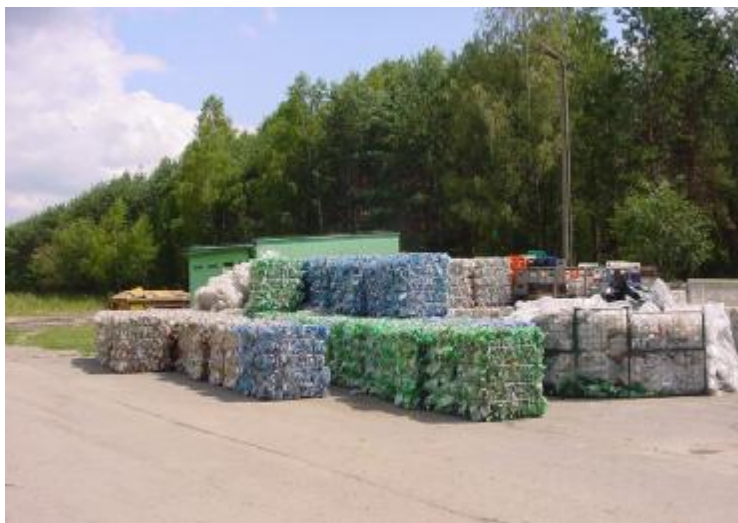
rys. nr 4 – składowisko odpadów komunalnych ZUO „Janik” Sp. z o.o.