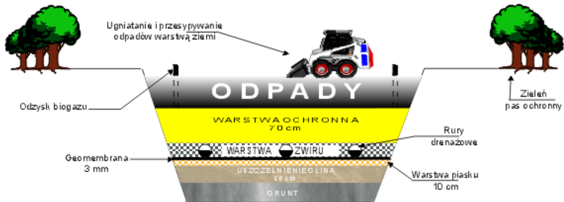
rys. nr1 - Schemat nowoczesnego składowiska odpadów komunalnych.