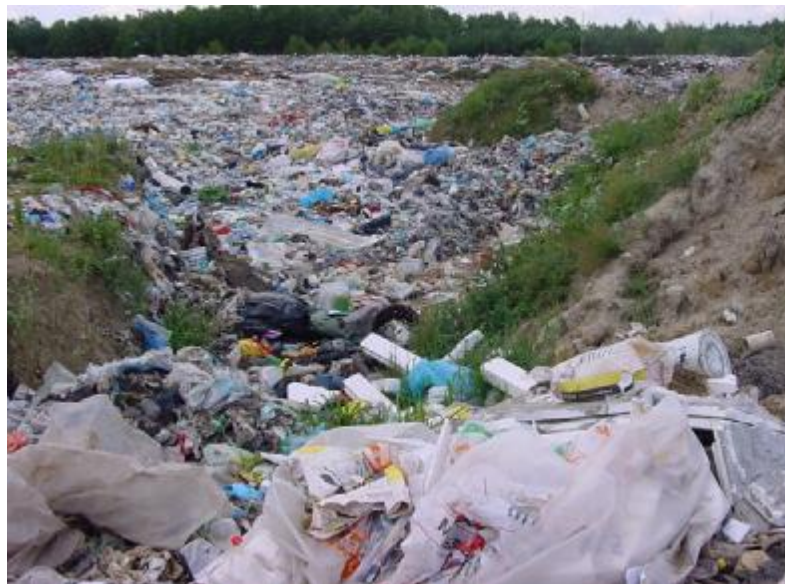
rys. nr 3 składowisko odpadów komunalnych ZUO „JANIK” Sp. z o.o.