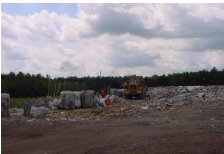
rys. nr 5 – składowisko odpadów komunalnych ZUO „Janik” Sp. z o.o.